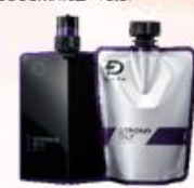
ストロングオイリー (超保湿肌用)