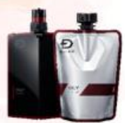
オイリー(脂性肌用)