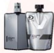
薬用スカルプ バックコンディショナー