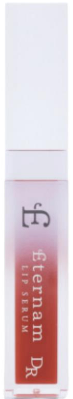
A004 フィグ ブラウン