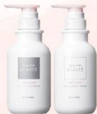
ボリュームタイプ

ハリコシ・ボリュームのある髪へ 根元からふんわり立ち上がる ボリューム感のあるスタイルへ 導きたい方